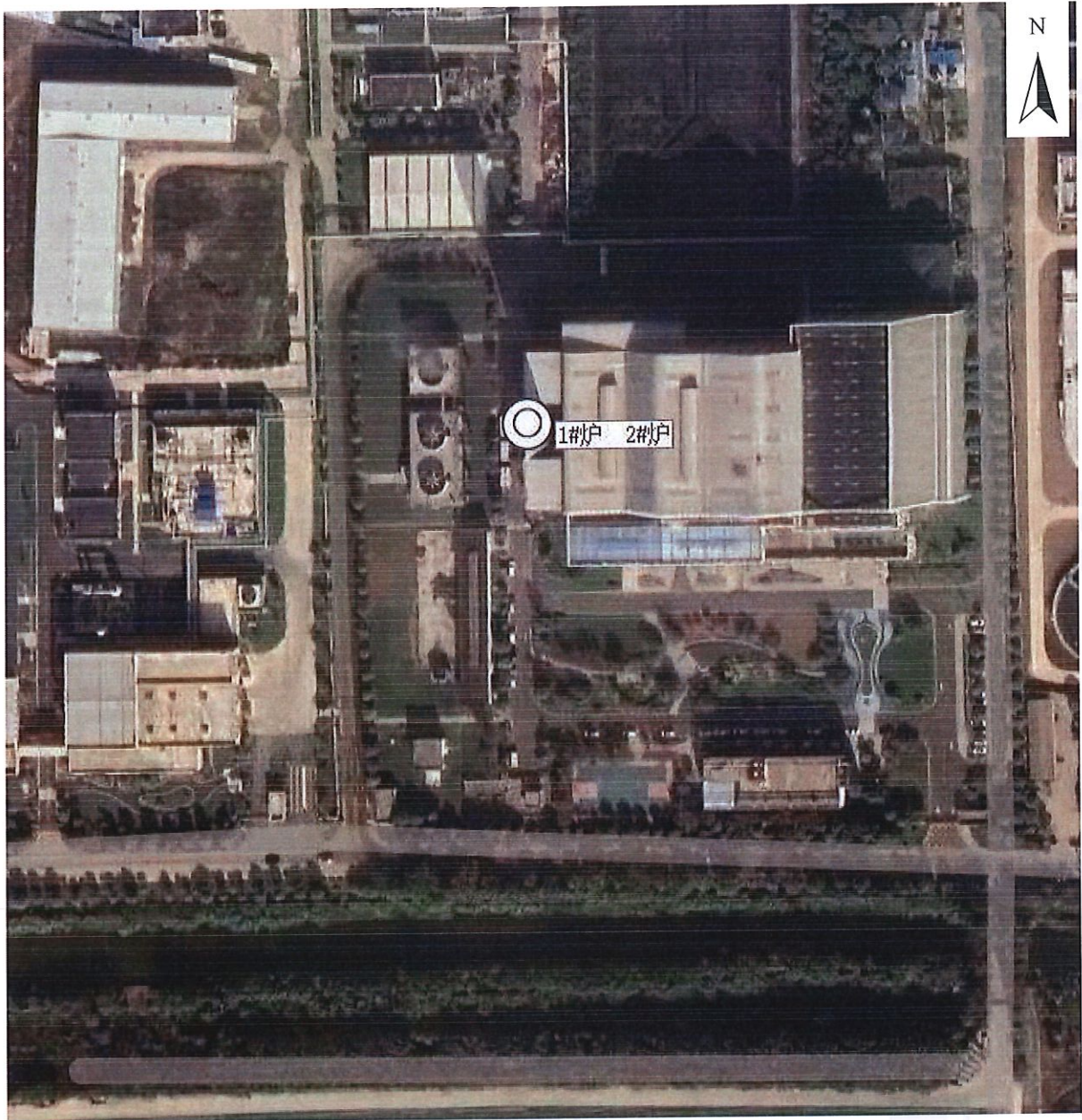
附图 1：监测点位示意图